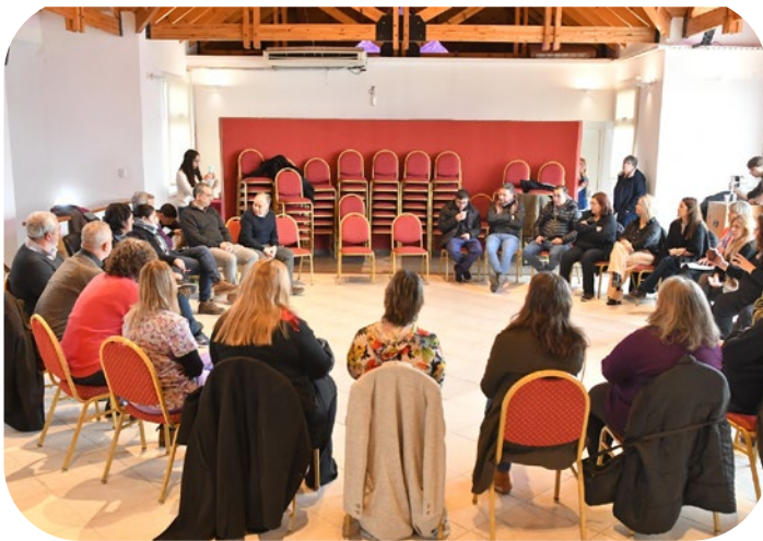
Asamblea de Monte Hermoso