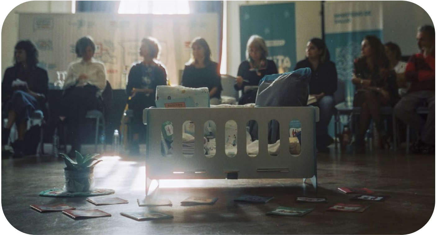
Ronda Qunita Bonaerense en el COSAPRO.

líneas de cuidado, mesas de trabajo y participación comunitaria e intersectorial, potencia la continuidad de cuidados y la transformación del modelo de atención de pacientes en un modelo de cuidado y acompañamiento de las personas gestantes y las niñas.