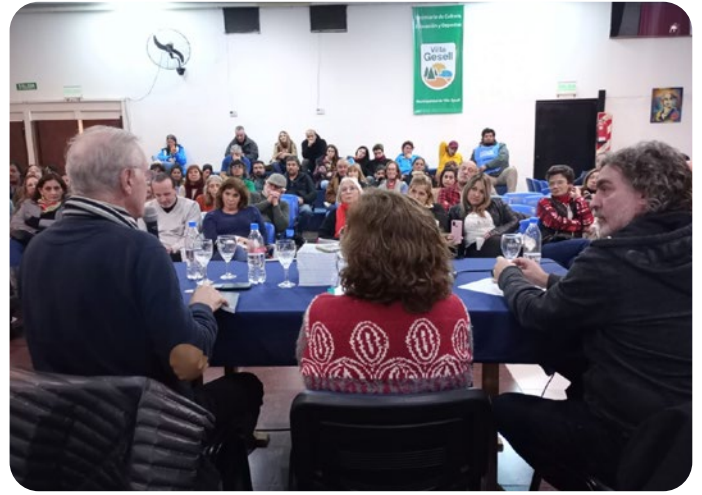
Plenario Regional en Villa Gesell