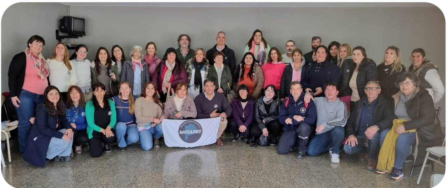
Asamblea en Tapalque