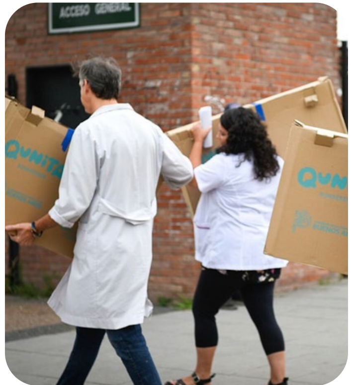
Distribución de kits Qunita en hospitales de la Provincia de Buenos Aires.

cuidados dando la bienvenida y acompañando para que cada recuerdo de cada familia de cada comunidad sea un recuerdo imborrable.