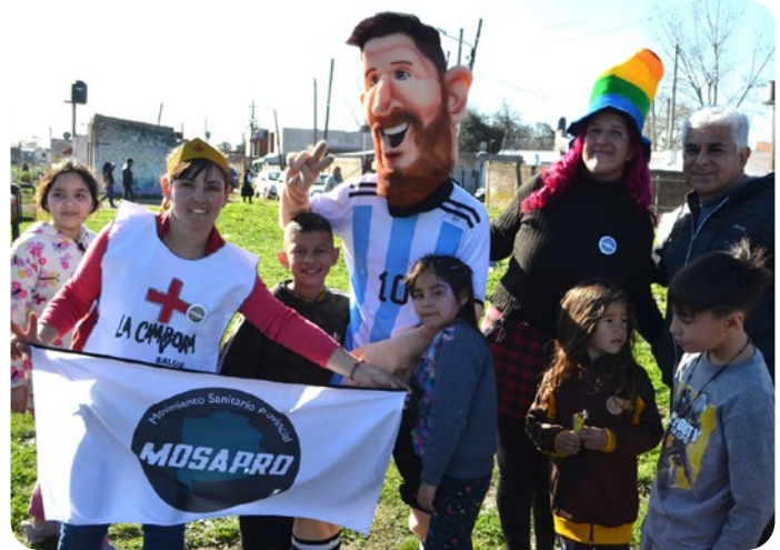
Jornada en Almirante Brown