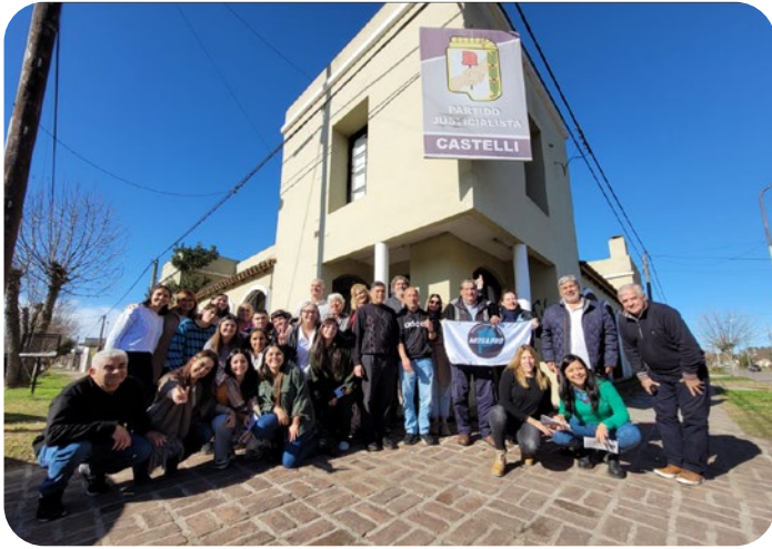
Asamblea de Castelli