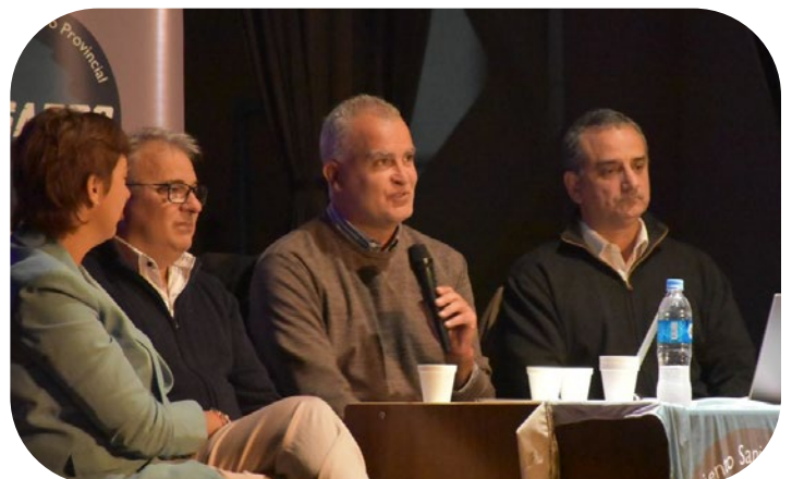
Asamblea en Tronquist