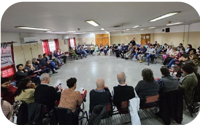
Asamblea en Moreno