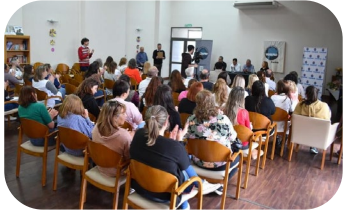
Asamblea en Guamini