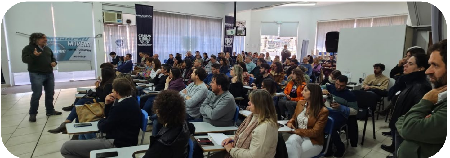
Asamblea en Coronel Suarez