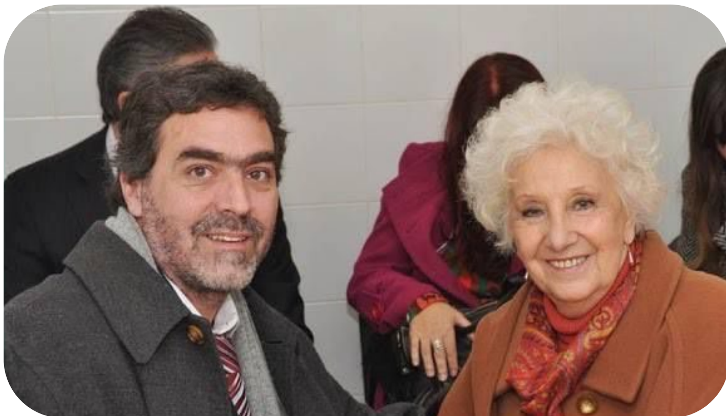
"20 de Julio de 2013. Día que el Pueblo de Moreno, imposición del nombre "Maternidad Estela De Carlotto". Un orgullo muy fuerte de poder compartir con Estela esa alegría y con los sueños intactos.

La opción en este proceso electoral es clara. Hay dos modelos en pugna desde el principio de nuestra historia y cada vez es más explícito que de gobernar la derecha avanzamos hacia la destrucción de los valores de la democracia, hacia un régimen autoritario que elimine derechos, favorezca a minorías agrupadas en corporaciones en contra de los intereses del Pueblo. La organización popular va a hacer posible que nuestras UTOPIAS sigan vivas y cada día se acerquen más a convertirse en realidades. Y el MOSAPRO es un actor relevante en ese proceso.