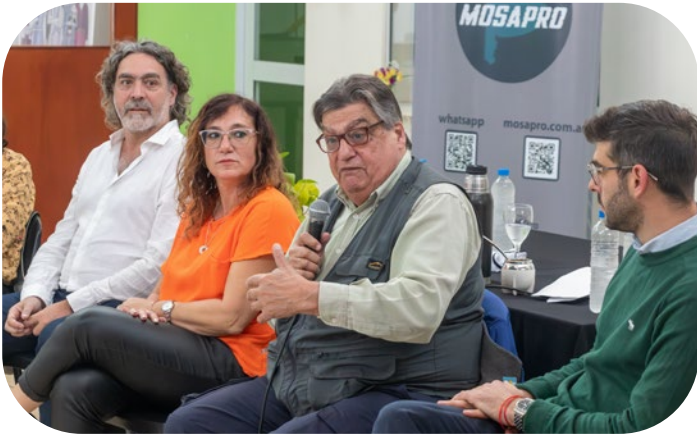
Asamblea en Chivilcoy