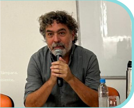
-Responsable de la unidad coordinadora del Consejo de Salud de la Provincia -Referente del MO.SA.PRO