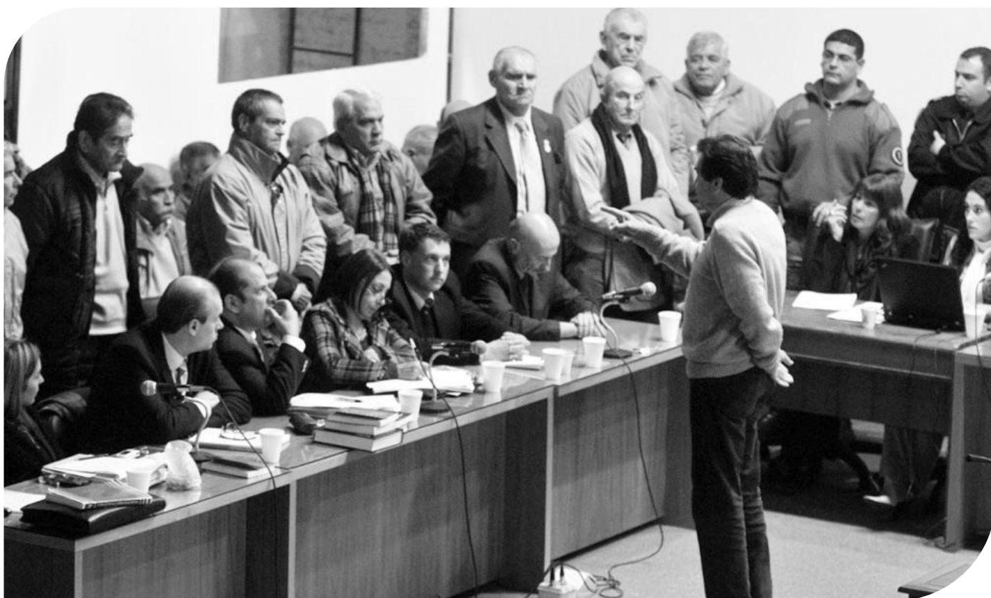
Juicio por delitos de lesa humanidad. año 2010

La primera condición es quitarle al otro la condición de humanidad "es un subversivo, es un terrorista", las mismas afirmaciones por el cual la mujer es un ser inferior o por lo que el esclavo no era un ser humano, o sea, en determinados momentos de la historia se justifica primero quitándole la condición de humanidad al otro y lo que quieren es quitarnos la memoria, reafirmar esta idea de que hubo una lucha contra la subversión, que había otro que había que aniquilar y no podía ser juzgado, porque estaba justificado en términos históricos, porque la subversión era una manera de atacar la patria como lo es la